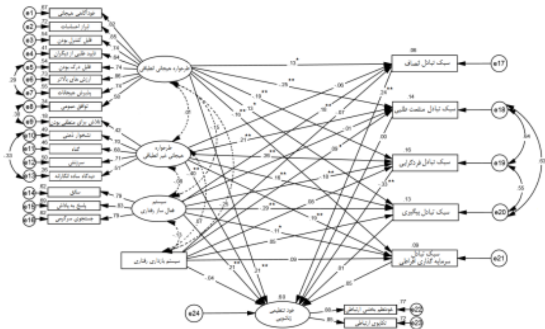
شکل ۲. مدل ساختاری با استفاده از ضرایب استاندارد

اطلاعات جدول ۲، نشان می‌دهد که مفروضهٔ نورمال بودن توزیع داده‌های تک‌متغیری که در آن، مقادیر کشیدگی و چولگی در محدودهٔ +۲ و -۲ قرار داشتند، برقرار بوده است. ضریب تحمل متغیرهای پیش‌بین، بزرگ‌تر از ۰/۱ و مقادیر عامل تورم واریانس کوچکتر از ۱۰ بود که حاکی از رعایت مفروضهٔ هم‌خطی بودن داده‌ها است. همچنین تحلیل اطلاعات مربوط به فاصلهٔ مه‌نوبایس و مفروضهٔ هم‌گنی واریانس از طریق بررسی نمودار پراکندگی واریانس‌های استاندارد شده خطاها مورد بررسی قرار گرفت و حاکی از برقرار پروضه‌های مدنظر در بین داده‌ها بودند. در ادامه، شکل ۲ که تصویر مدل ساختاری با استفاده از ضرایب استاندارد است و سپس جدول ۳ که اشاره به شاخص‌های برازش مدل دارد، آورده می‌شود.